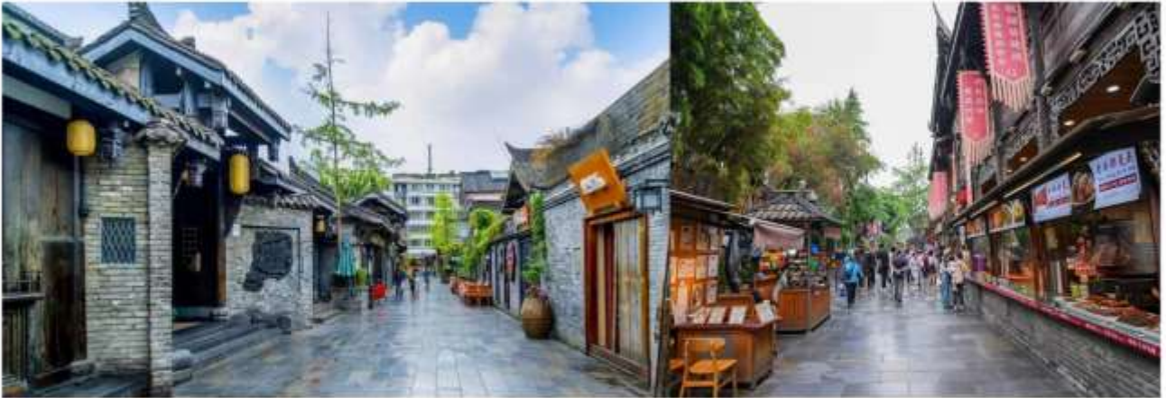
กลางวัน รับประทานอาหาร ณ ภัตตาคาร

จากนั้นนำท่านสู่ ถนนชอยกว้าง-ชอยแคบ ย่านโบราณที่มีประวัติยาวนานตั้งแต่สมัยราชวงศ์ซิง โดดเด่นด้วยสถาปัตยกรรมจีนโบราณผสมผสานความทันสมัยของร้านคาเฟ่ และร้านอาหารท้องถิ่นมากมาย อิสระให้ท่านเดินเล่น ชิมขนมพื้นเมือง เลือกซื้อของฝาก และถ่ายภาพกับมุมสวย ๆ