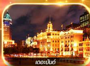
เดอะบอนด์