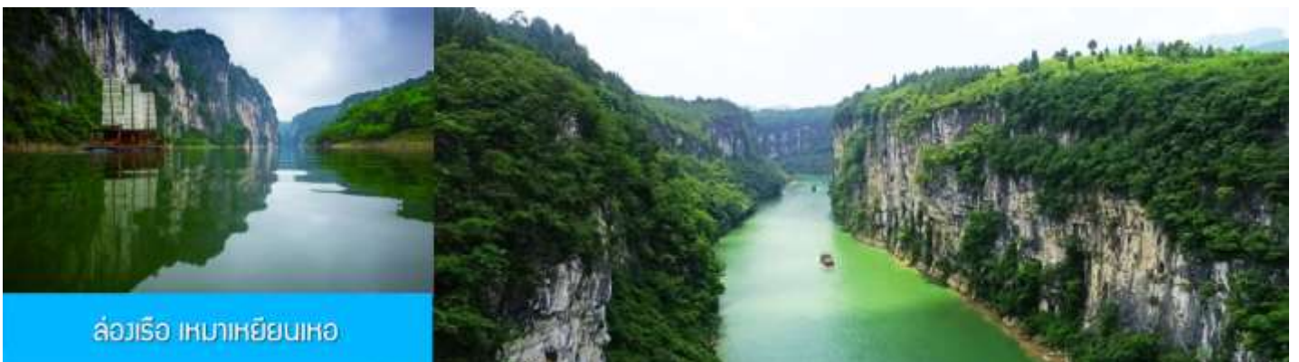
ล่องเรือ เหมาเหยียนเหอ