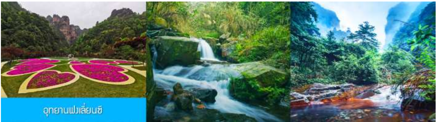
อุทยานฟงเลี่ยนซี