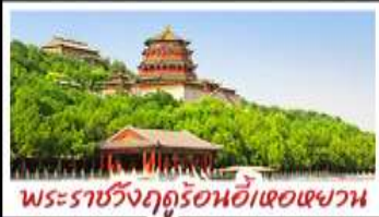
พระราชวังฤดูร้อนอี้เหอหยวน

ท่าแพงเมืองจีนค่ามจวียงกวน - พระราชวังฤดูร้อนอี้เหอหยวน สวนจึงอัน - วัดลามะ - โม่หลงร้านซ้อป - โรงแรม 4 ดาว มือพิเศษ เปิดบิกกิ้ง สุก๊ิมองโก MICHELIN GUIDE ร้าน TAO TAO JU