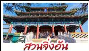
สวนจึงอัน