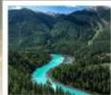
อุทยานคานาสือ