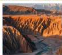
แกรนด์แคนยอนดูซานจื่อ