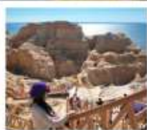
เขตปิกางทะเล