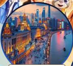
หาดไวทาน