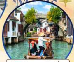
เมืองโบราณจูเจียเจีย