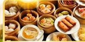
อาหารกวางตุ้ง