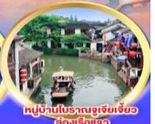
หมู่บ้านโบราณจูเจียเจี้ยว ล่องเรือแจว