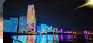
หาด No.3 Bathing