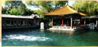
บ่อน้ำพุร้อนเป้าทุเจวี่ยน