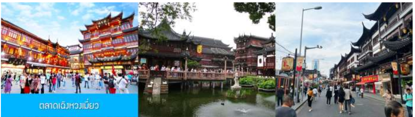
ตลาดเดินหวงเมี่ยว

รับประทานอาหารเช้า ณ ห้องอาหารของโรงแรม (6)