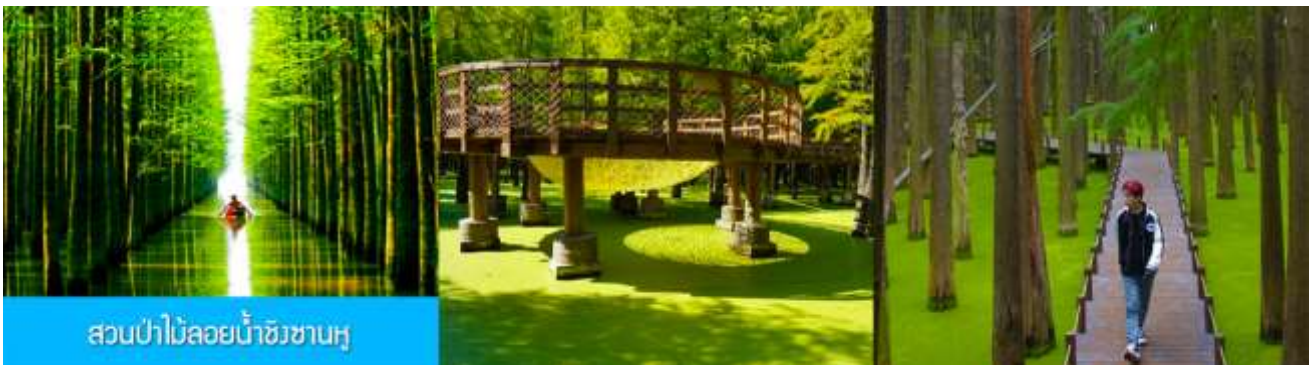
สวนป่าไม้ลอยน้ำชิงซานหู

หลังอาหารเช้าท่านเดินทางโดยรถบัสสู่เมืองหลิงอัน 临安市 (ระยะทาง 175 กม. ใช้เวลาเดินทางราว 2 ชั่วโมงเศษ)