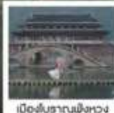
เมืองโบราณผิงหวง