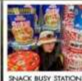
SNACK BUSY STATION