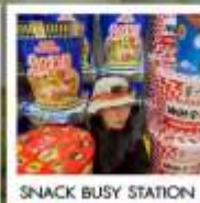
SNACK BUSY STATION