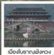
เมืองโบราณฟังหวง