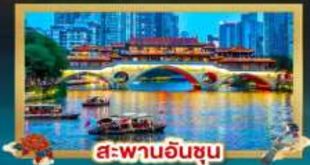
สะพานอันชุน