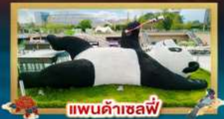
แพนด้าเซลฟี

ชมวัฒนธรรมชาติแบบ 360 องศา "อุทยานนกภูเขาซีดรุณี"