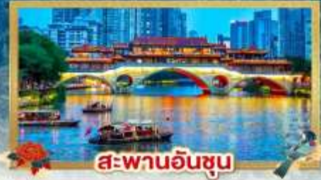
สะพานอันซุน