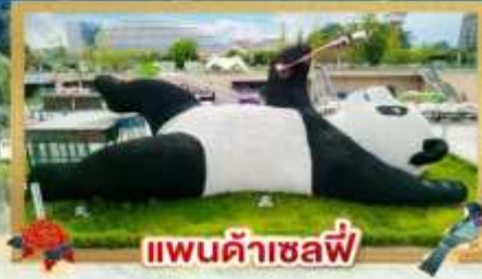
แพนด้าเซลฟี