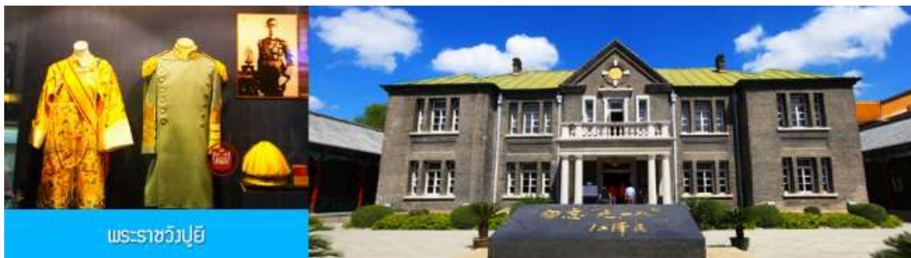
พระราชวังปูยี

รับประทานอาหารเช้า ณ ห้องอาหารของโรงแรม (7)