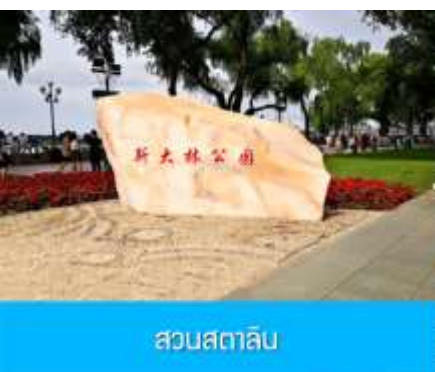
สวนสตาลิน