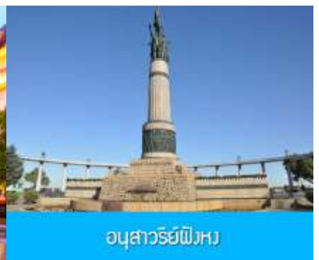
อนุสาวรีย์พิงหวง

หลังอาหารนำท่านชม โบสถ์ เซนต์โซเฟีย 索菲亚教堂 (ชมด้านนอก) อีกหนึ่งสัญลักษณ์ที่โดดเด่นของเมืองฮาร์บิน สร้างขึ้นในปี ค.ศ. 1907 เป็นโบสถ์คริสต์นิกายออร์ทอดอกซ์ ที่ใหญ่ที่สุดในเอเชียตะวันออกเฉียง ที่แสดงถึงอิทธิพลของวัฒนธรรมรัสเซียที่มีต่อเมืองฮาร์บิน