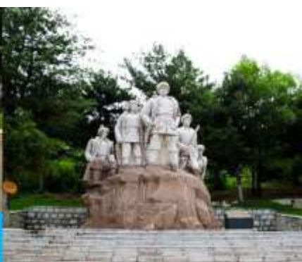
ถนนจงย้งลู่