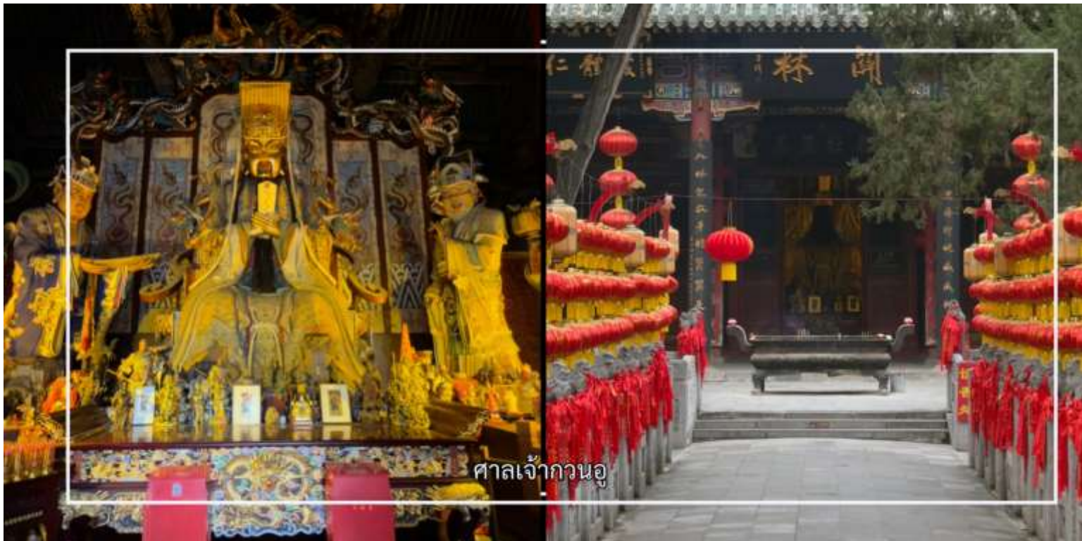
ศาลเจ้ากวนอู

จากนั้นนำท่าน สักการะ ศาลเจ้ากวนอู สถานที่ศักดิ์สิทธิ์ที่มีความเกี่ยวข้องกับ “กวนอู” วีรบุรุษผู้เป็นสัญลักษณ์แห่งความซื่อสัตย์ ความกล้าหาญ และคุณธรรมตามคติจีน ซึ่งได้รับการเคารพนับถืออย่างแพร่หลายทั้งในหมู่ชาวจีนและชาวเอเชีย ที่นี่เป็นที่ฝัง “ศิระษะ” ของกวนอู ตามตำนานในยุคสามก๊ก นอกจากนี้ ท่านจะได้สัมผัสบรรยากาศของเมืองโบราณ ชมสถาปัตยกรรมอันทรงคุณค่า เรียนรู้เรื่องราวจากยุคสามก๊ก และดื่มด่ำกับวัฒนธรรมท้องถิ่นที่ยังคงสืบทอดมาจนถึงปัจจุบัน