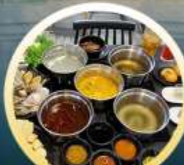
ชาบูฮ่องกง

02-04 มิ.ย. 18-20 มิ.ย. 07-09 มิ.ย. 20-22 มิ.ย. 13-15 มิ.ย. 25-27 มิ.ย. 14-16 มิ.ย. 28-30 มิ.ย.