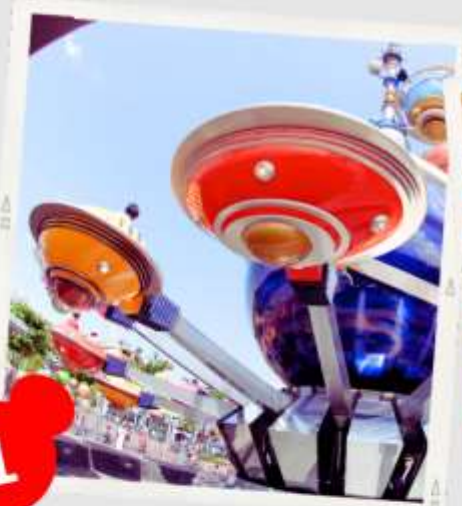
MAIN STREET USA