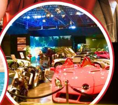
Royal Automobile Museum