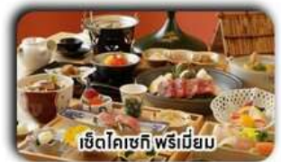
เซตโคเชกิ พรีเมียม