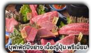
บุฟเฟ่ต์บิงย่าง เนื้อญี่ปุ่น พรีเมียม