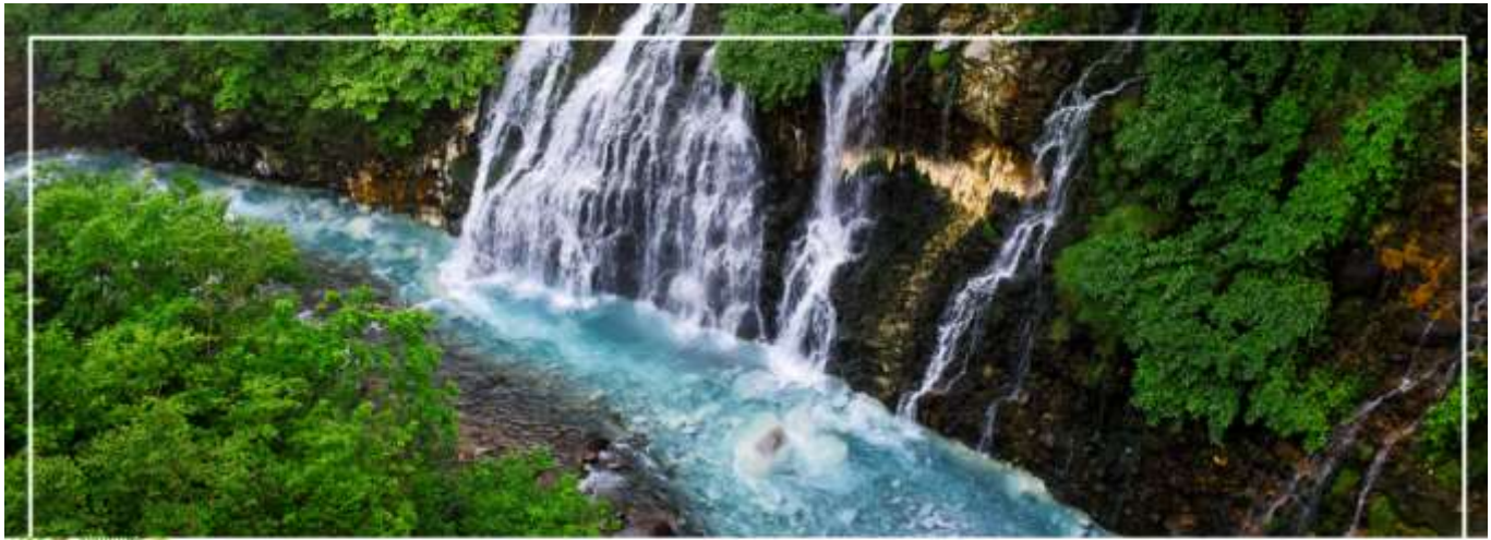
SHIRAHIGE WATERFALL น้ำตกชิราฮิเกะ

วันที่สอง ทำอากาศยานนิวซีโดเสะ สอกไกโด – เมืองบิเอะ – น้ำตกชิราฮิเกะ – สระอะโออิเคะ หรือ บ่อน้ำสีฟ้า – เมืองอาซาฮิดาวา – อีออน อาซาฮิดาวา