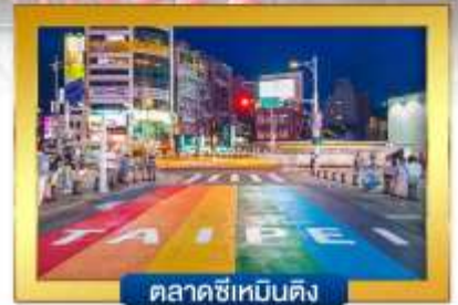
ตลาดซีเหมินติง