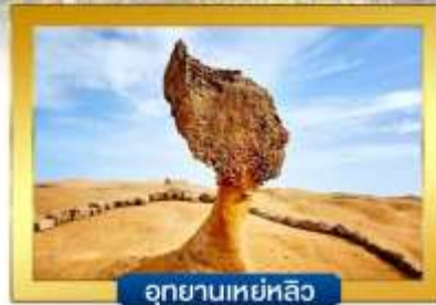
อุทยานเหยือกหลิว