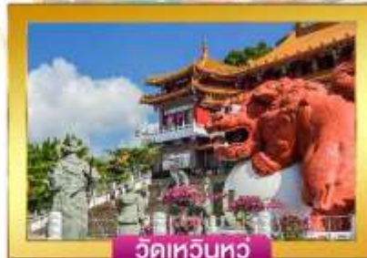
วัดเหวินหัว