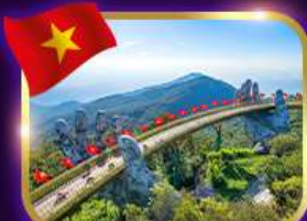
สะพานมือสีทอง บานาฮิลล์